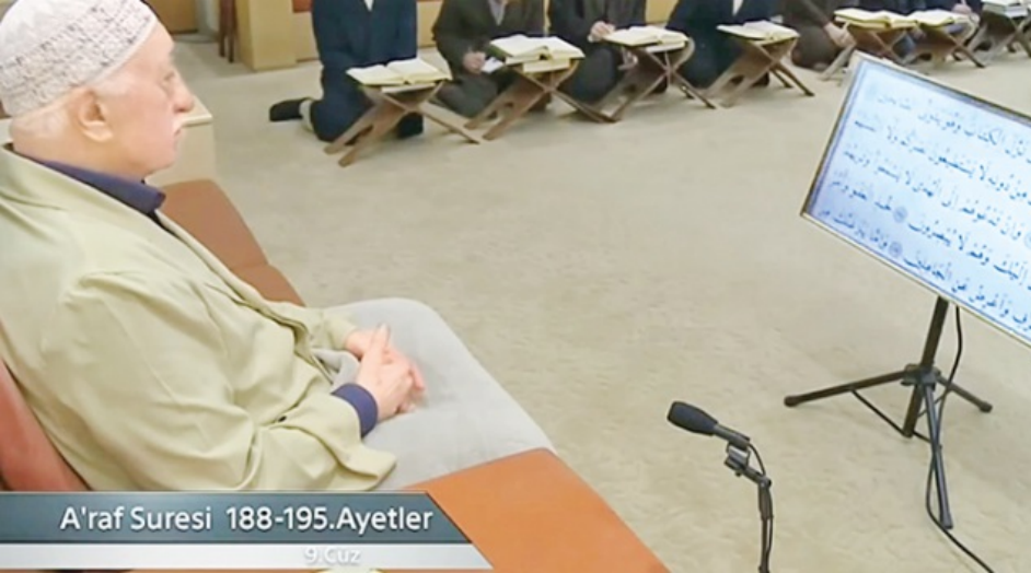
A'raf Suresi 188-195.Ayetler

11.08.2017 - 06:58 | Son Güncelleme: 11.08.2017 - 07:00