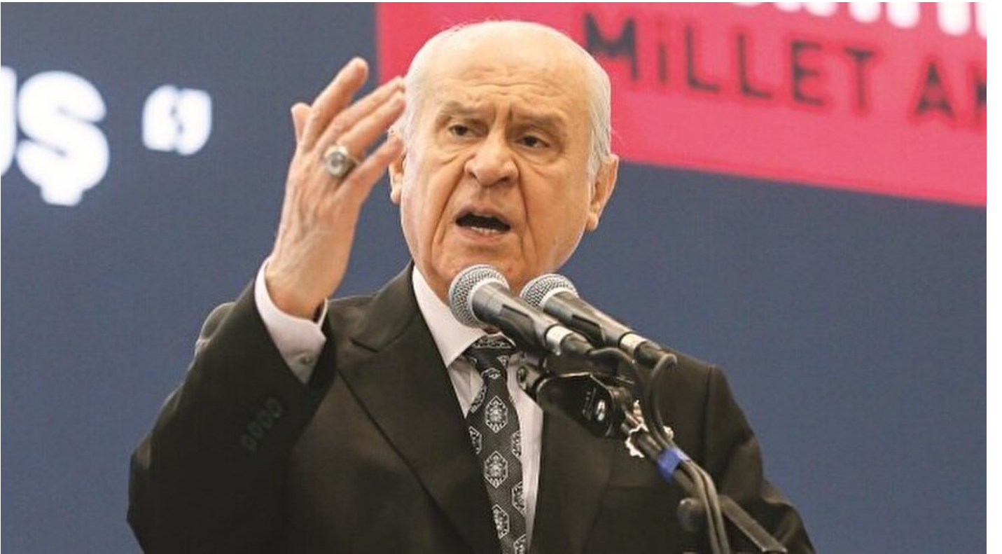
MHP Genel Başkanı Devlet Bahçeli