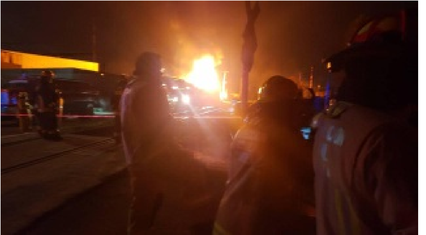
Dolmabahçe Sarayı'nda yangın!