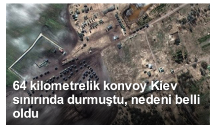
64 kilometrelik konvoy Kiev sınırında durmuştu, nedeni belli oldu