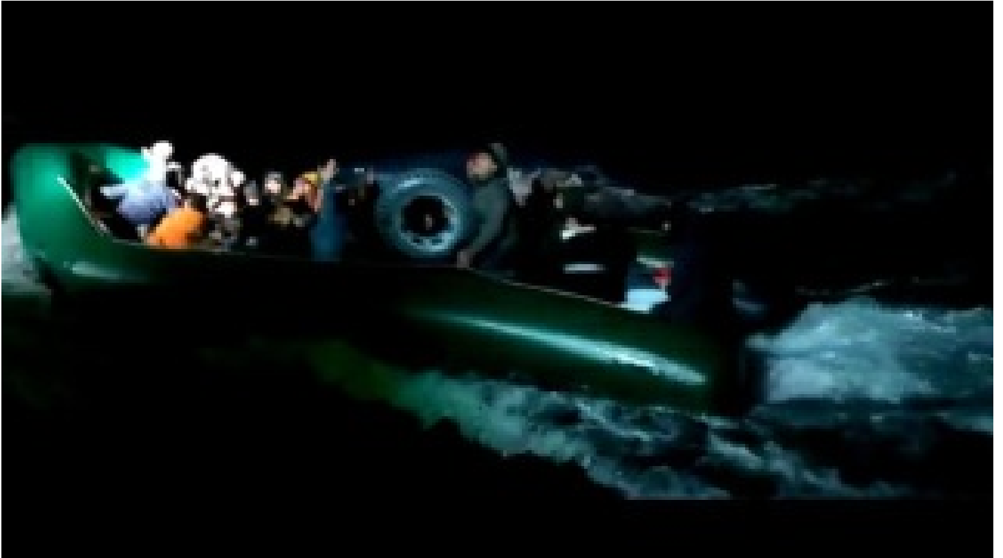
Muğla açıklarında 35 düzensiz göçmen yakalandı