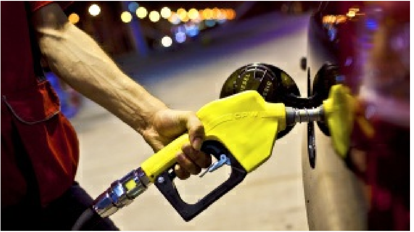
Benzin ve motorinde fiyat artışı