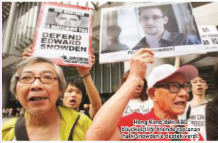
Hong Kong'daki ABD büyükelçiliği önünde toplanan halkı Snowden'e destek verdi.

ABD Ulusal Güvenlik Dairesi'nin (NSA) mahkemeye kararıyla gizlice telefon ve internet haberleşmelerinin kayıtlarını toplaması, Barack Obama yönetimini zora sokmuş durumda. Washington'ın telefon ve internet kayıtlarını izleme programının ayrıntılarını ortaya çıkaran eski CIA casusu Edward Snowdenin bütüncü ortamı