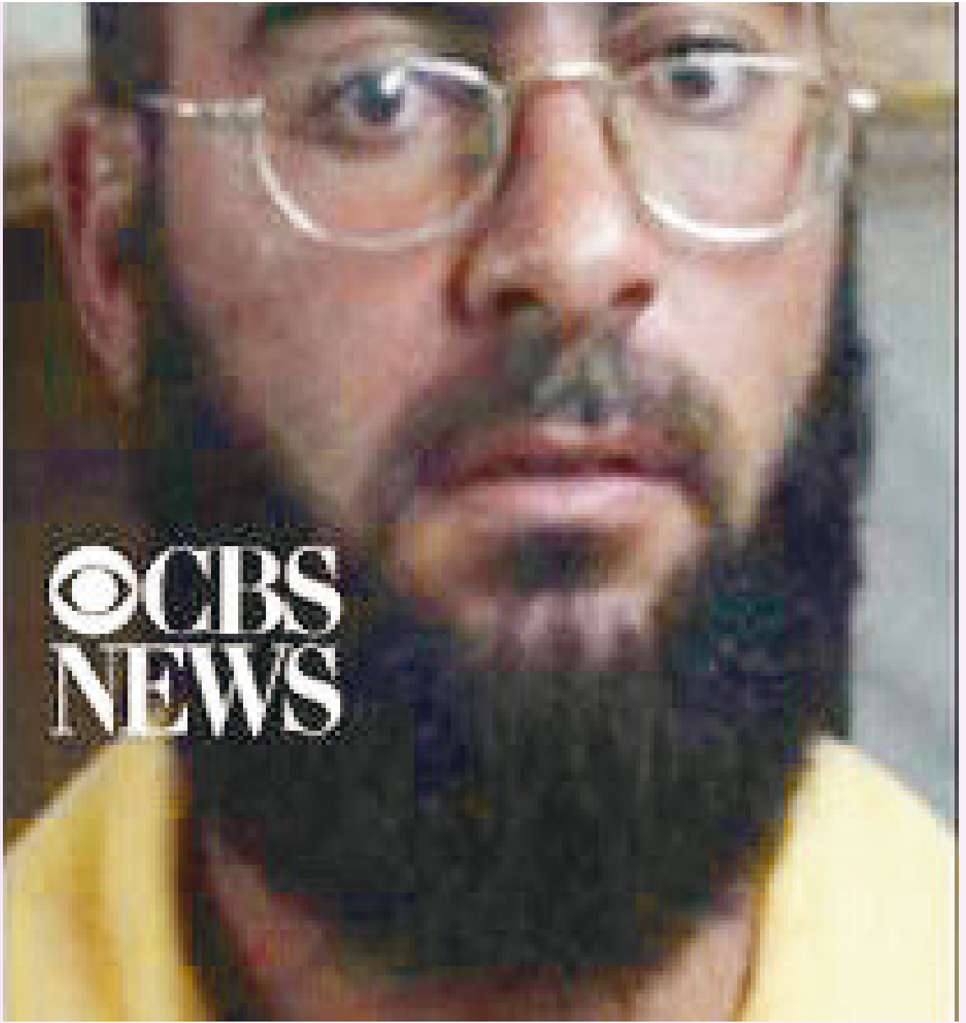
Irak'ta kaldığı Bukka Kampı'ndan ayrılırken ABD'li komutana "New York'ta görüşürüz" diyen IŞİD elebaşı Ebubekir el-Bağdadi.