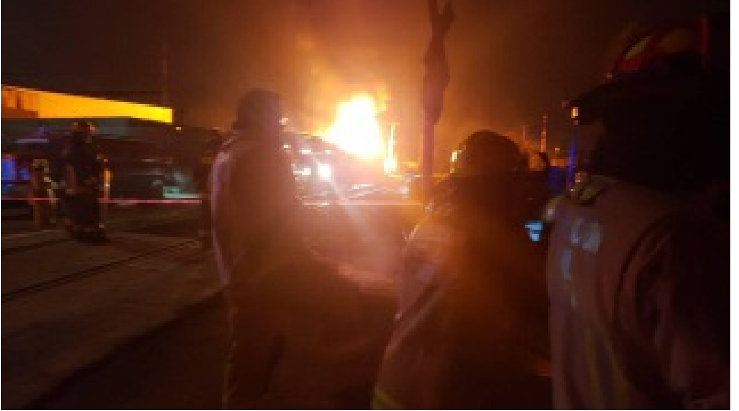
Dolmabahçe Sarayı'nda yangın!