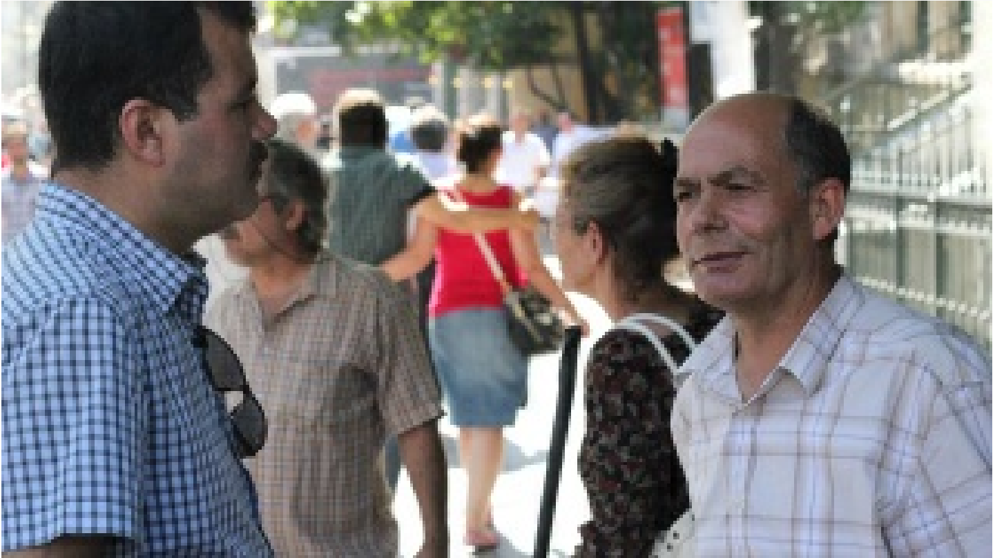
İliğine işlemiş cesaret erdemi... Onun için zor değil olağandı