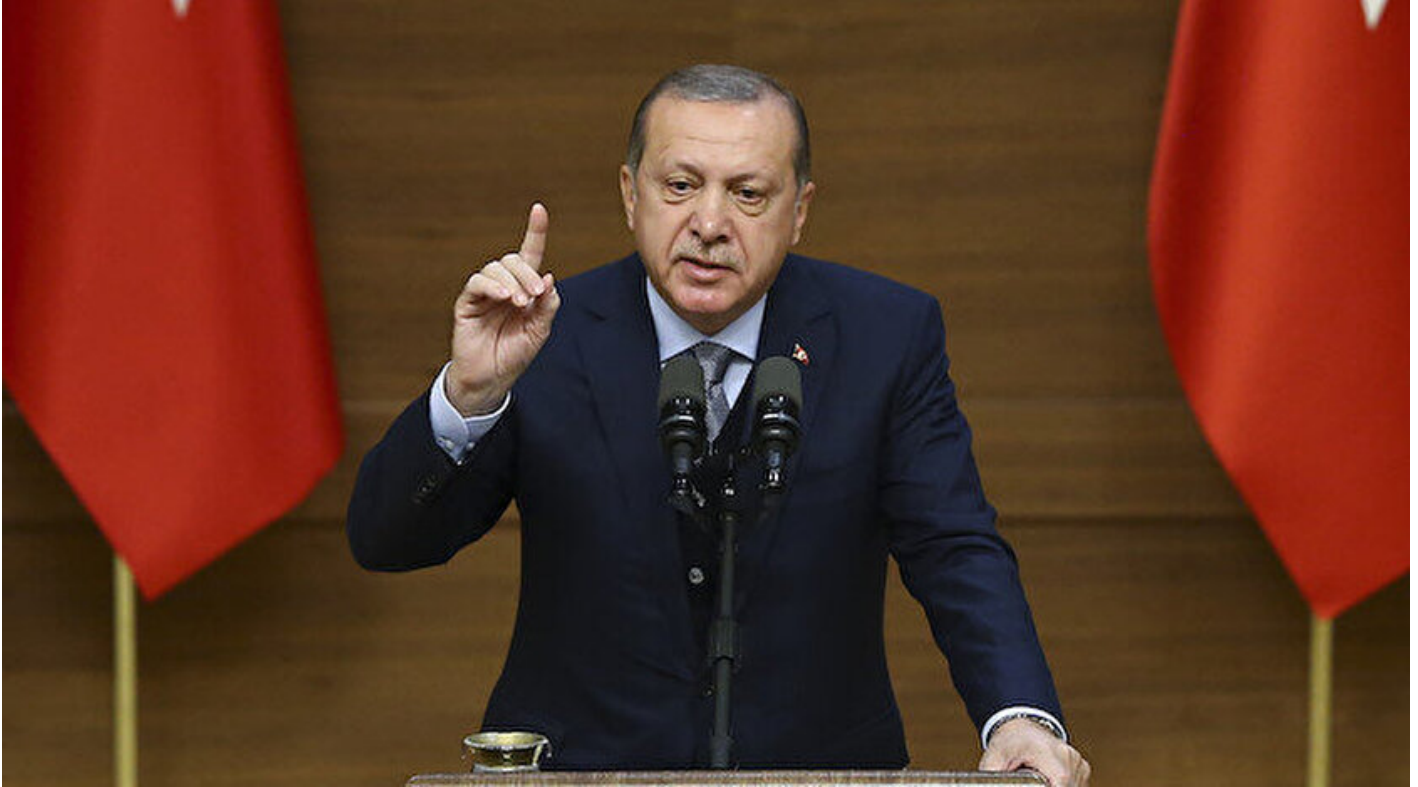
Cumhurbaşkanı Recep Tayyip Erdoğan