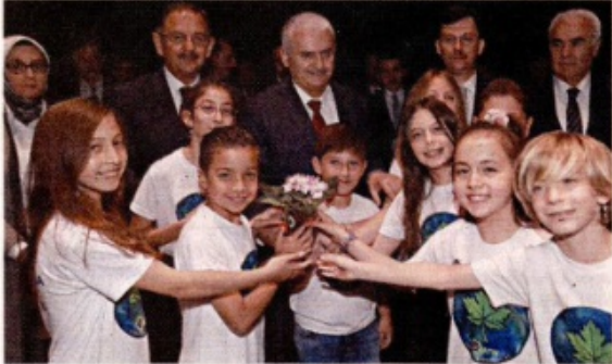
Çevre ve Şehircilik Bakanlığınca düzenlenen Çevre Projeleri Toplu Açılış Törenine katılan Binali Yıldırım'ın çocuklar yoğun ilgi gösterdi.