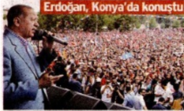
Erdoğan, Konya'da konuştu