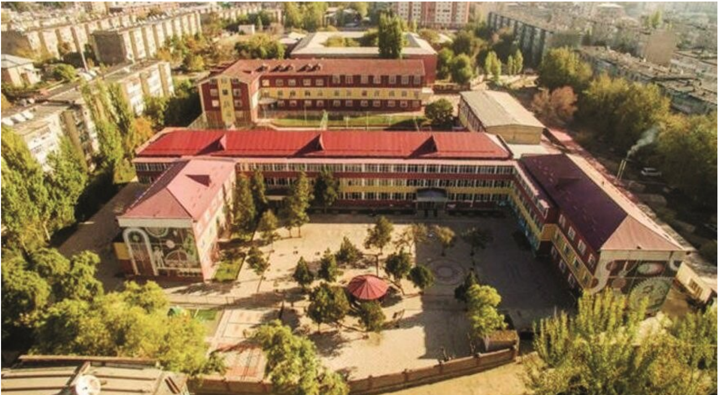
Kırgızistan’daki Sebat okullarından biri.

Cumhurbaşkanı Erdoğan’a “Tayyip Abi” diye hitap eden Kırgızistan Cumhurbaşkanı Almazbek Atambayev’in 15 Temmuz darbe girişimi sonrası yaptığı açıklamalar tepki çekmişti. Hatta Atambayev, FETÖ’nün Kırgızistan’da darbe yapabileceği yönündeki iddiaları “absürt” olarak nitelendirmişti. Atambayev’in Cumhurbaşkanı Erdoğan’ı farklı zamanlarda 5 kez aradığı belirtiliyor. Ancak Cumhurbaşkanı Erdoğan, Kırgız mevkidaşı Atambayev’in telefonlarına çıkmadığı ifade ediliyor.