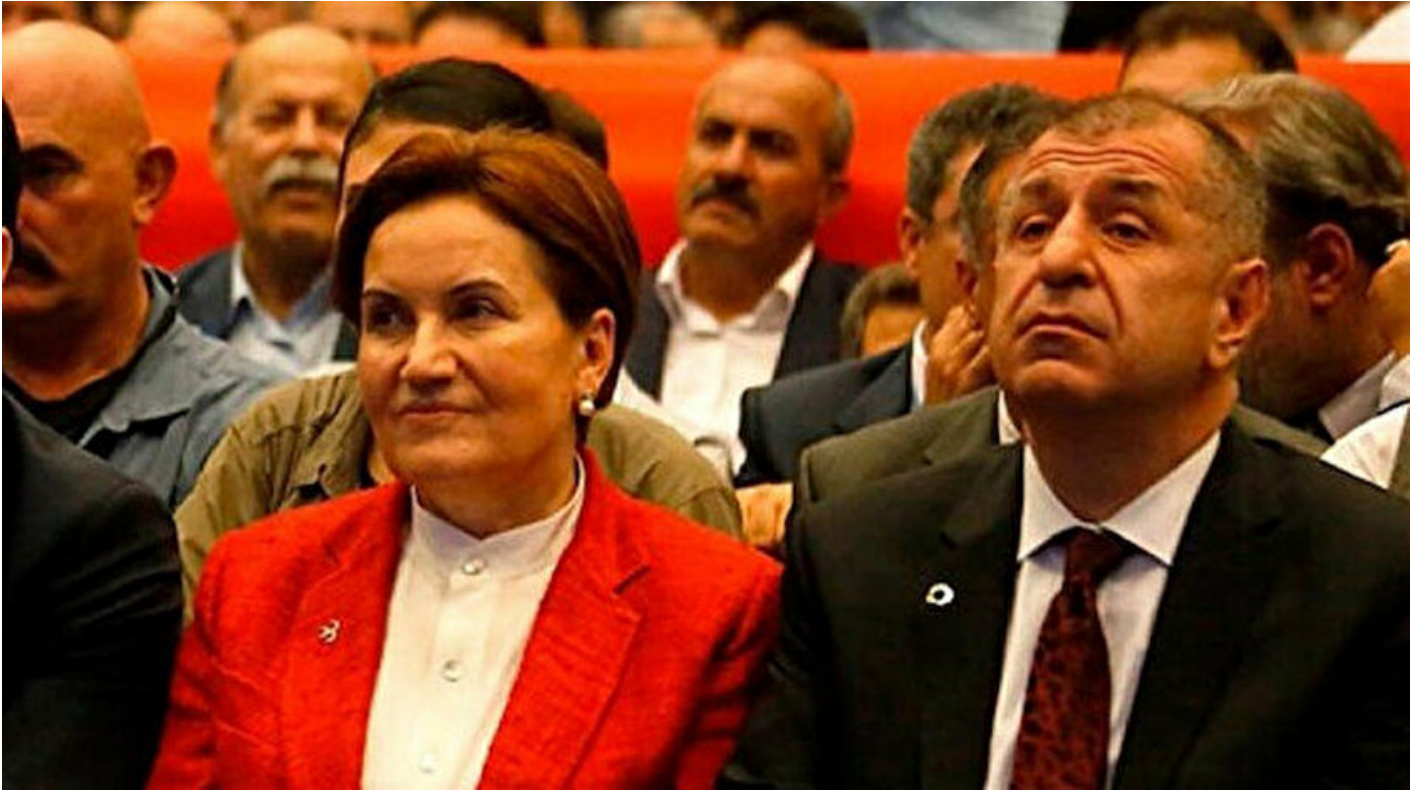
Meral Akşener ve Ümit Özdağ