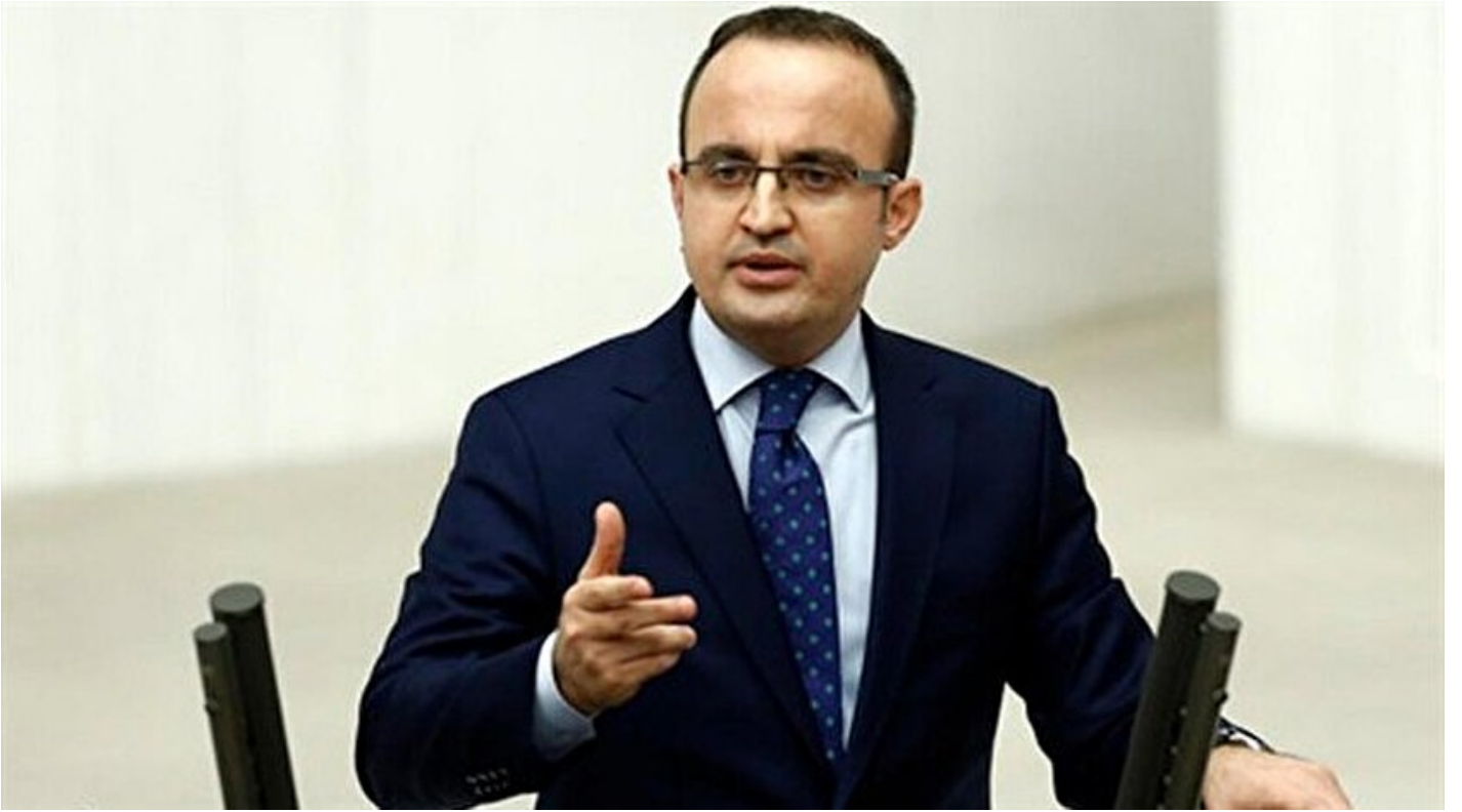
AK Parti Grup Başkanvekili Bülent Turan