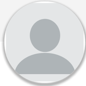
Salih Seçkin Sevinç