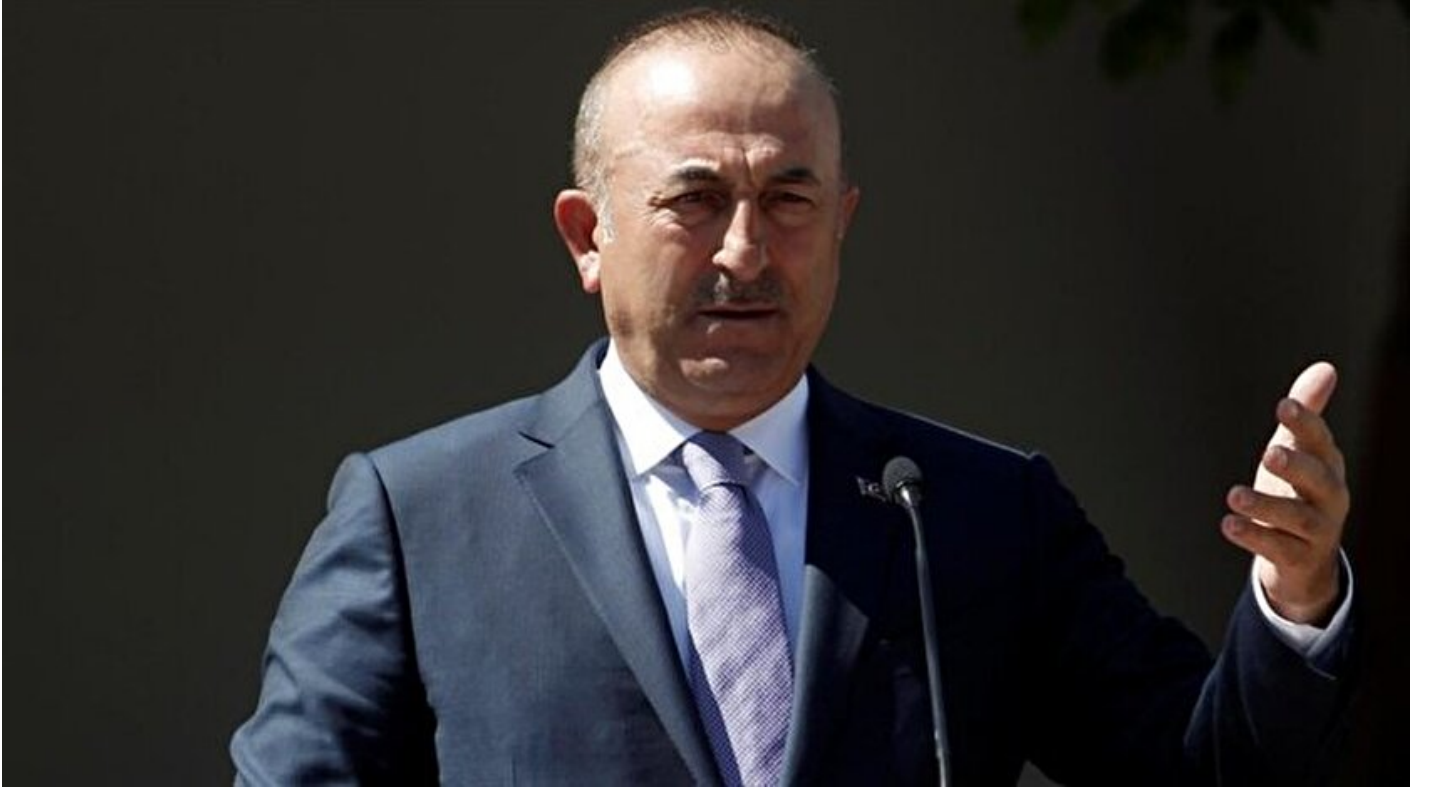
Dışişleri Bakanı Mevlüt Çavuşoğlu