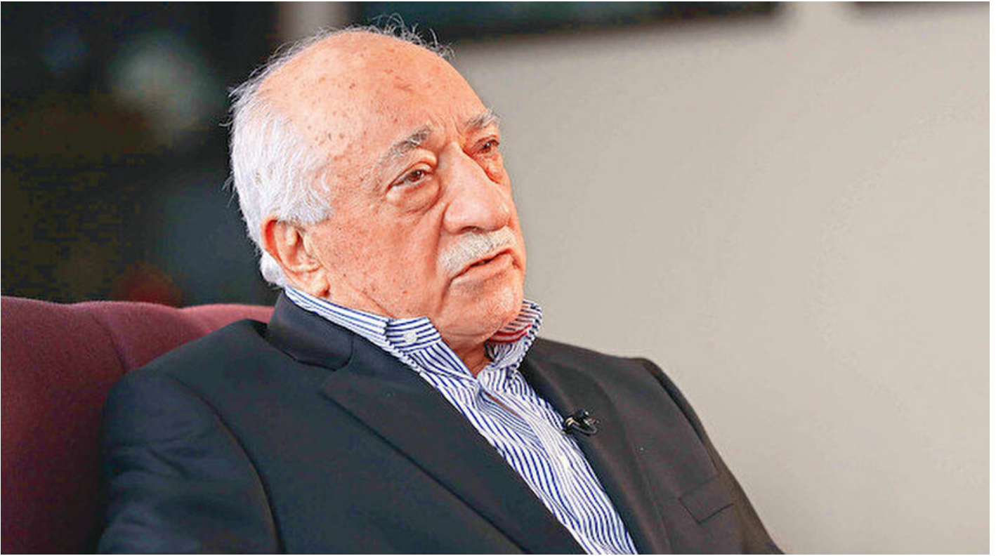
FETÖ elebaşı Gülen

Haber Merkezi · 09 Ekim 2020, 10:24 · Son Güncelleme: 09 Ekim 2020, 11:08 · AA