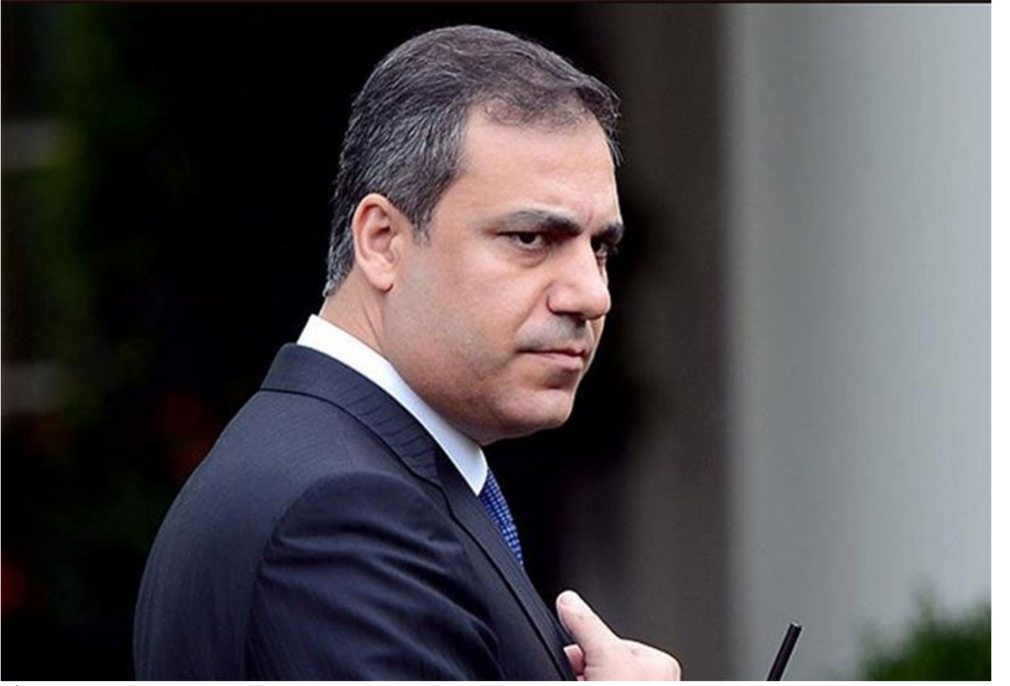
MİT Müsteşarı Hakan Fidan