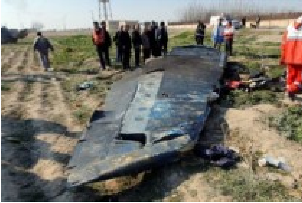
176 Kiři Hayatını Kaybetmiřti: İnan'dan Tazminat İstiyorlar