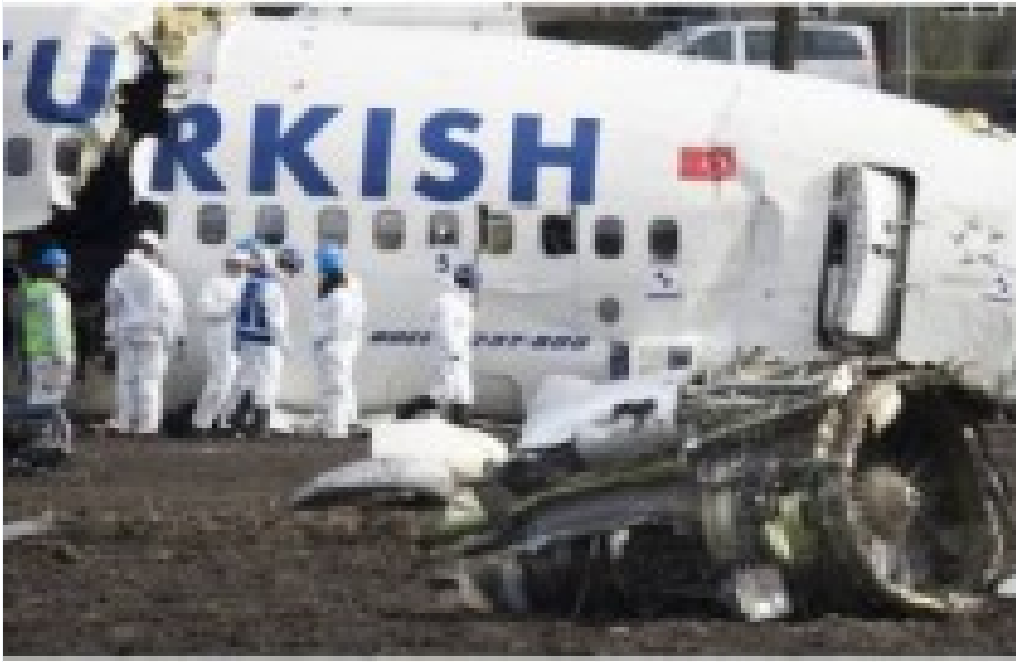
New York Times'dan Flaş THY İddiası!