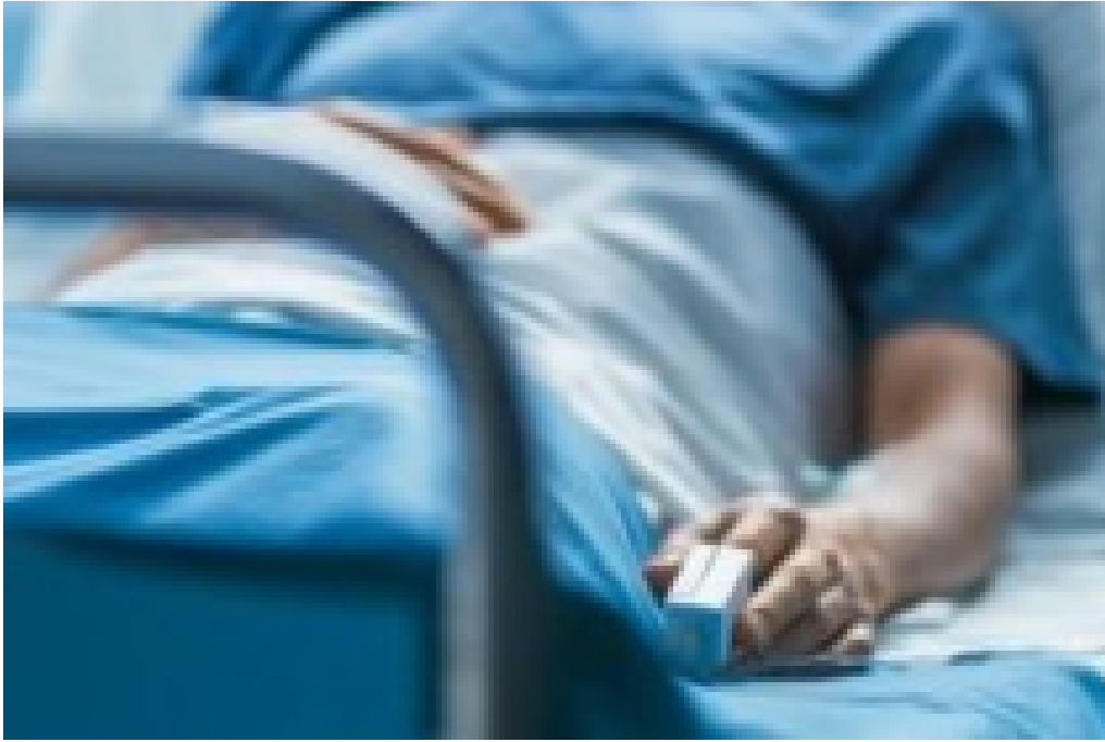
Ömrü 10 Yıl Uzatmanın Formülü Bulundu!