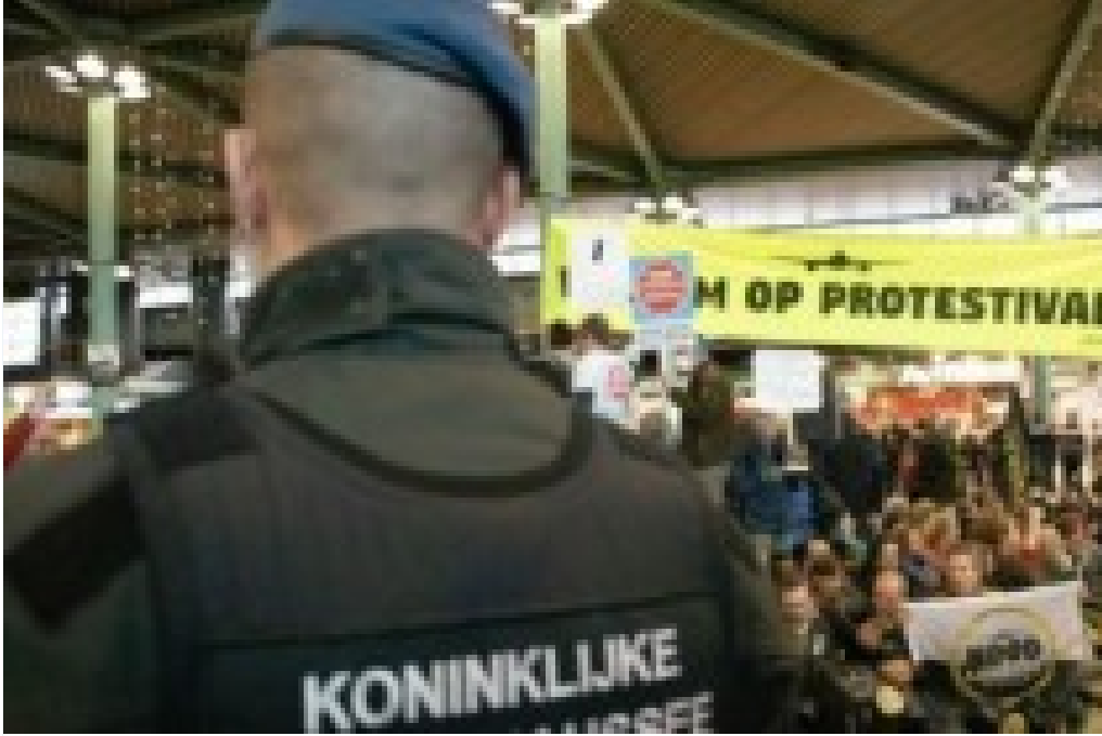
Hollanda'da Havalimanı'nı İşgal Etiler: İklim Protestocularından Büyük Eylem