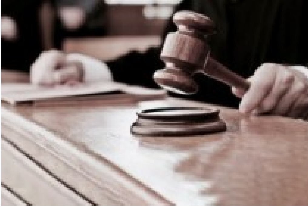
Hollanda Mahkemesi: Sözlü Taciz Yasası, İfade Özgürlüğüne Aykırı