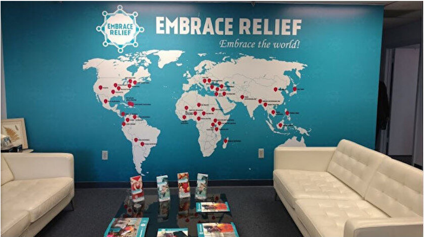
Embrace Relief Vakfı

M. Şakir Saraç · 04 Şubat 2019, 04:00 · Yeni Şafak