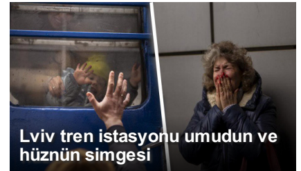
Lviv tren istasyonu umudun ve hüznün simgesi