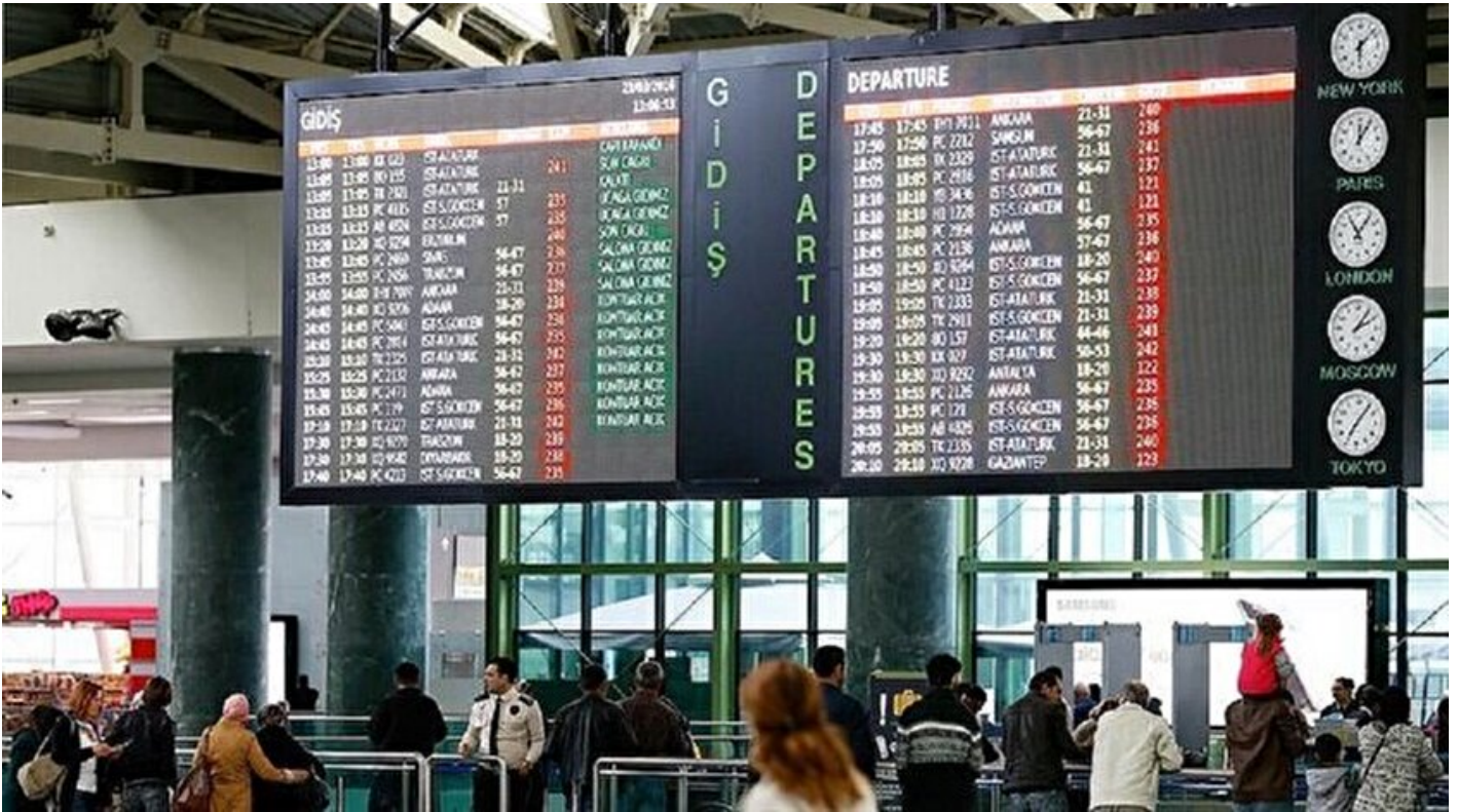
Adnan Menderes Havalimanı