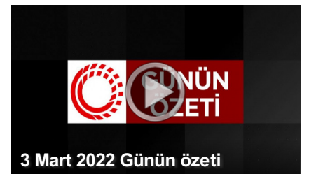
3 Mart 2022 Günün özeti