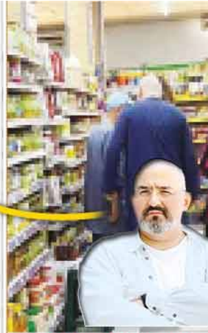
EŞİ VE KAYINPEDERİ YANINDA