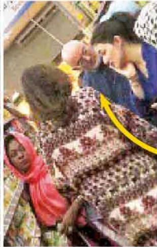
MARKETTE ALIŞVERİŞ YAPTI