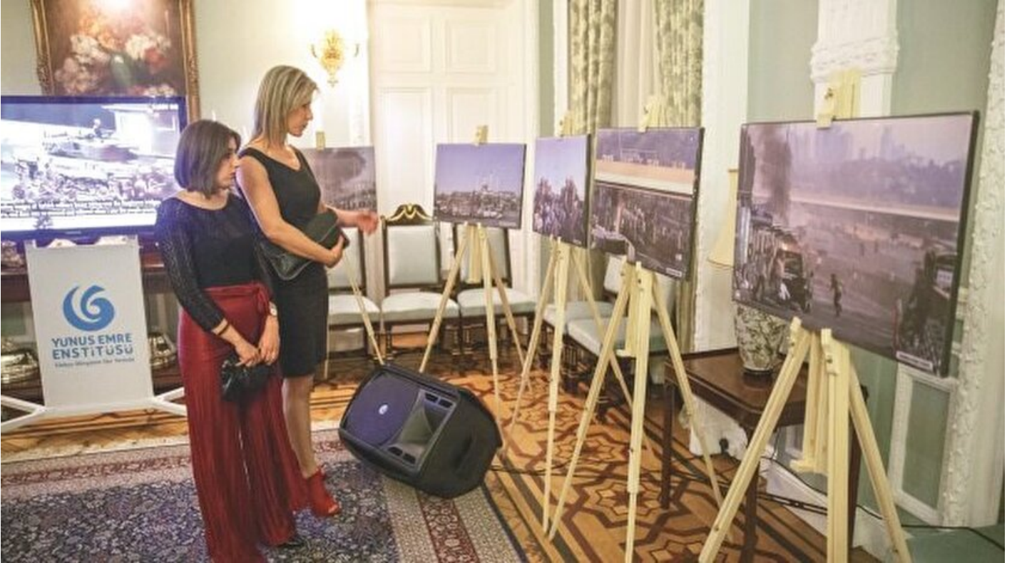
Londra'da 15 Temmuz sergisi

Hüseyin Likoğlu · 19 Şubat 2017, 04:00 · Son Güncelleme: 19 Şubat 2017, 05:44 · Yeni Şafak