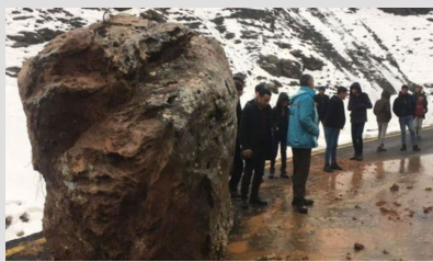
Mahalleliyi iki gündür tedirgin eden olay