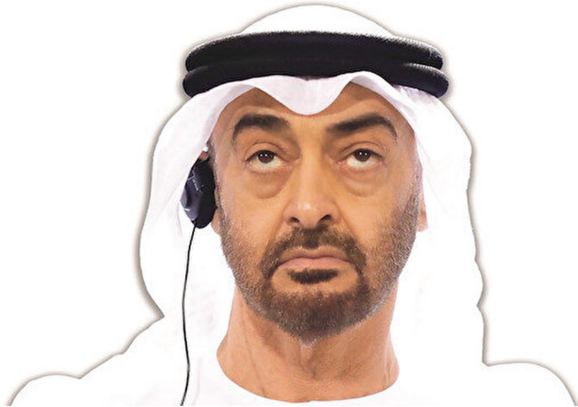
Muhammed bin Zayed