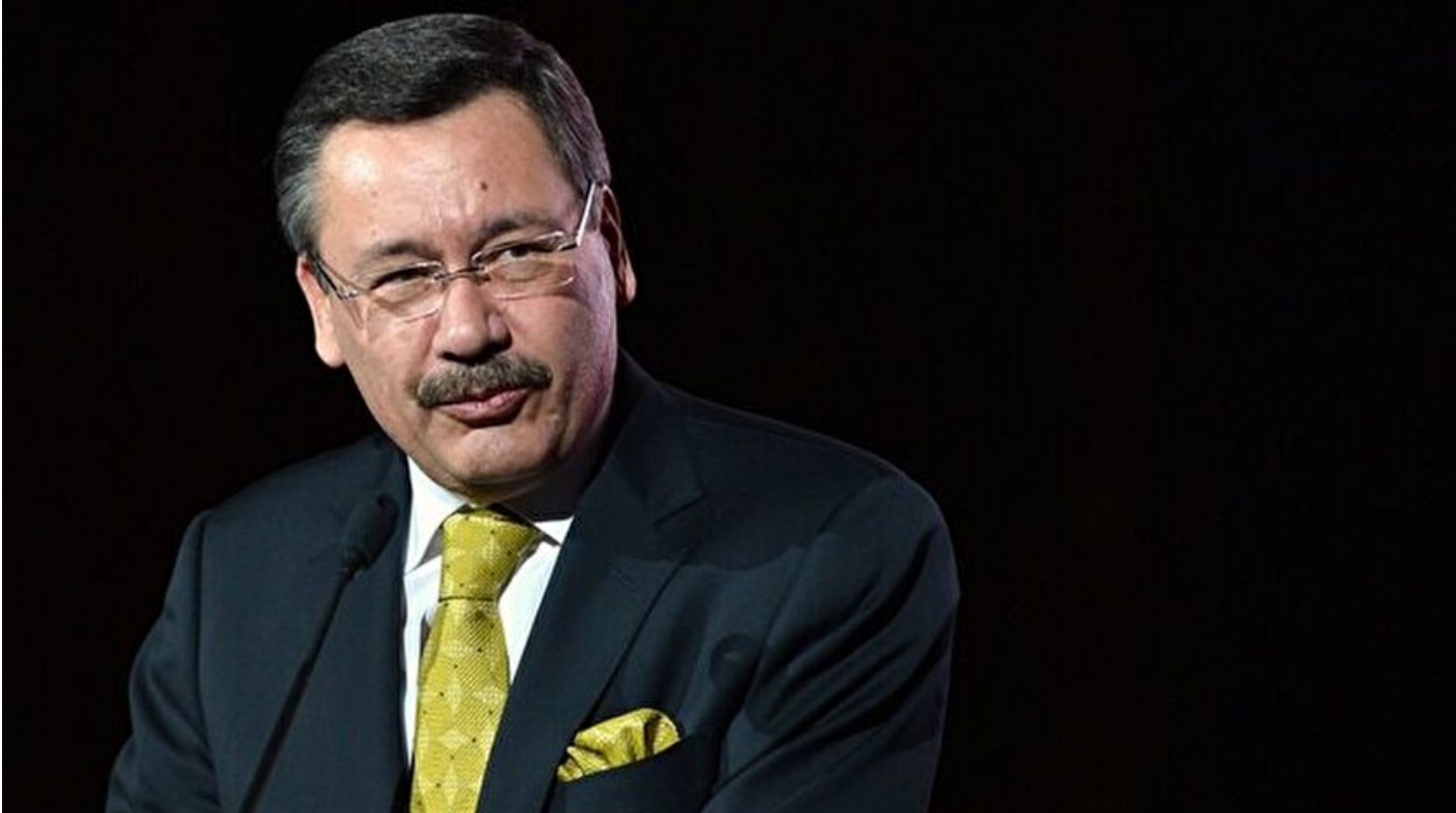
Ankara Büyükşehir Belediye Başkanı Melih Gökçek

Haber Merkezi · 19 Aralık 2016, 20:53 · Son Güncelleme: 19 Aralık 2016, 20:57 · Diğer