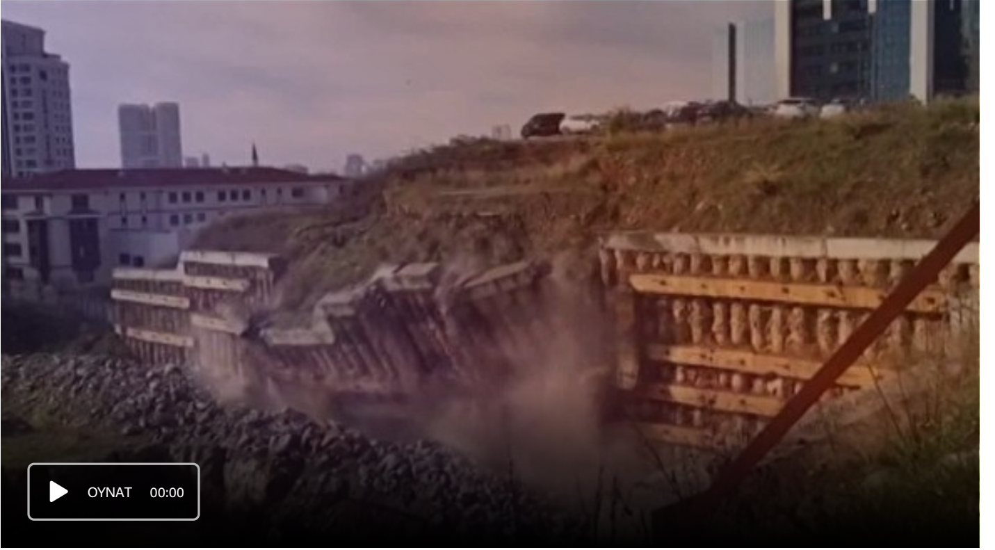
Ataşehir'de dev istinat duvarının çökme anı saniye saniye kamerada

İstanbul Ataşehir Belediyesi'nin yanında, FETÖ'ye ait bir okul olması planlanan inşaat alanının kenarındaki duvar çökünce otoparktaki araçlar asılı kaldı.