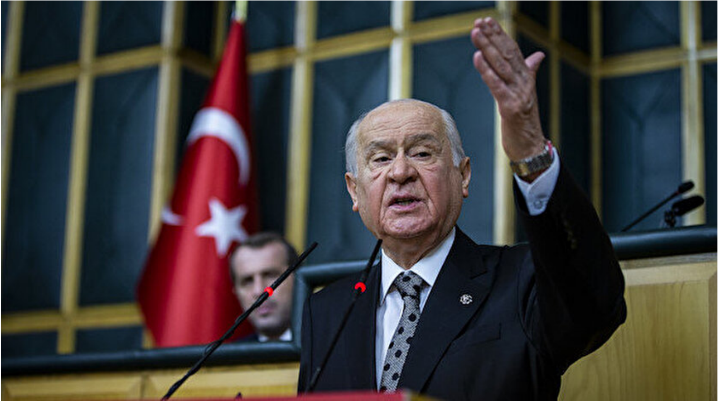
MHP Genel Başkanı Devlet Bahçeli

Haber Merkezi · 09 Temmuz 2019, 10:45 · Son Güncelleme: 09 Temmuz 2019, 11:33 · Yeni Şafak