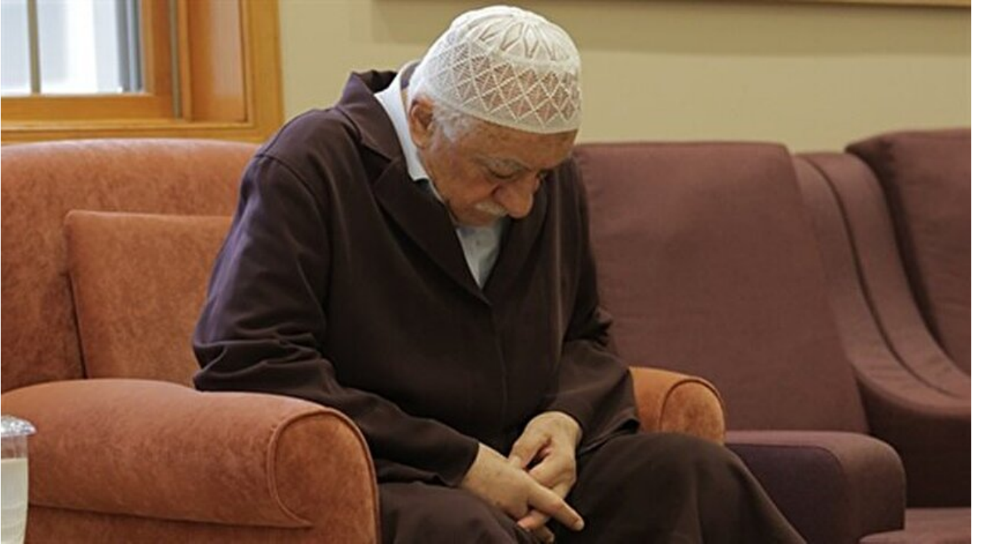
FETÖ elebaşı Fetullah Gülen

Haber Merkezi · 25 Ağustos 2016, 13:57 · Son Güncelleme: 25 Ağustos 2016, 14:50 · AA