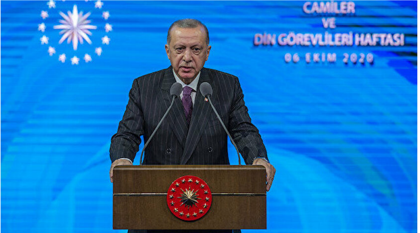
Cumhurbaşkanı Recep Tayyip Erdoğan.

Haber Merkezi · 06 Ekim 2020, 15:16 · Son Güncelleme: 06 Ekim 2020, 16:22 · Yeni Şafak