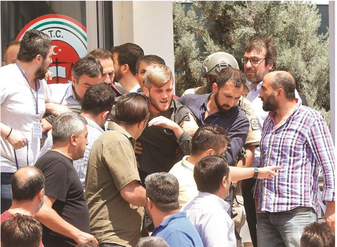
44 sanığın beraat kararını duyan vatandaşlar olaya tepki gösterdi.

Mahkeme, biri asteğmen, 43'ü er 44 sanığın da tüm suçlardan beraatine hükmetti. Mahkemenin kararını değerlendiren İstanbul Cumhuriyet Başsavcılığı, taleplerine aykırı olarak 39 sanık hakkında verilen beraat kararını temyiz edeceğini açıkladı.