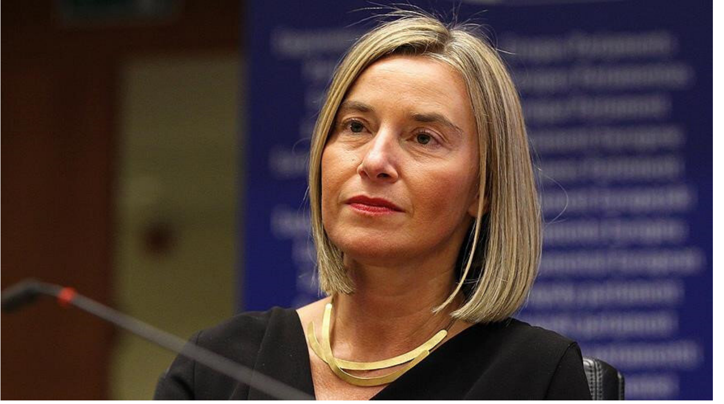
AB Yüksek Temsilcisi Mogherini

Burada konuşan Avrupa Birliği (AB) Dış İlişkiler ve Güvenlik Politikası Yüksek Temsilcisi Federica Mogherini, toplantının olumlu, yapıcı, verimli ve dürüst geçtiğini söyledi.