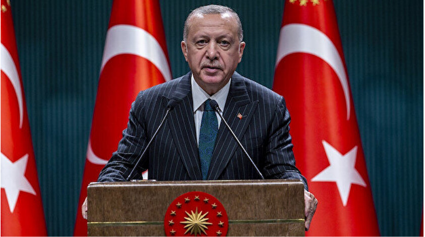
Recep Tayyip Erdoğan

Haber Merkezi · 17 Aralık 2020, 17:56 · Son Güncelleme: 17 Aralık 2020, 18:26 · AA