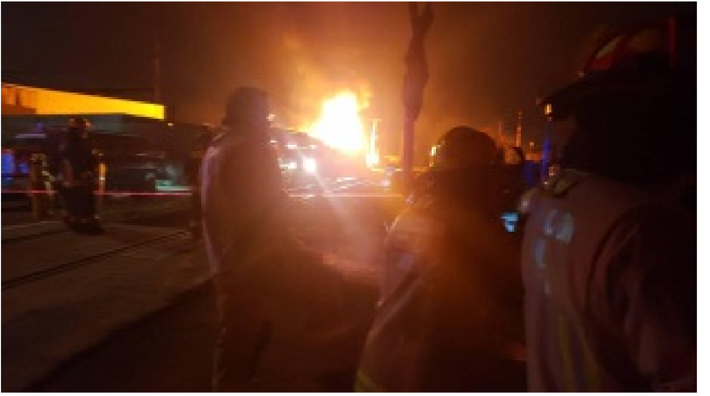
Dolmabahçe Sarayı'nda yangın!