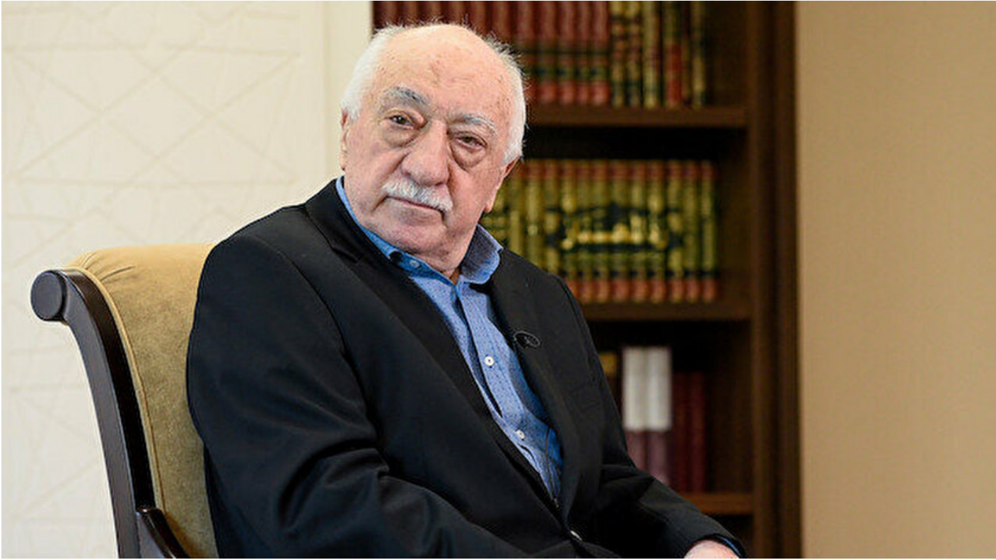
FETÖ elebaşı Fetullah Gülen