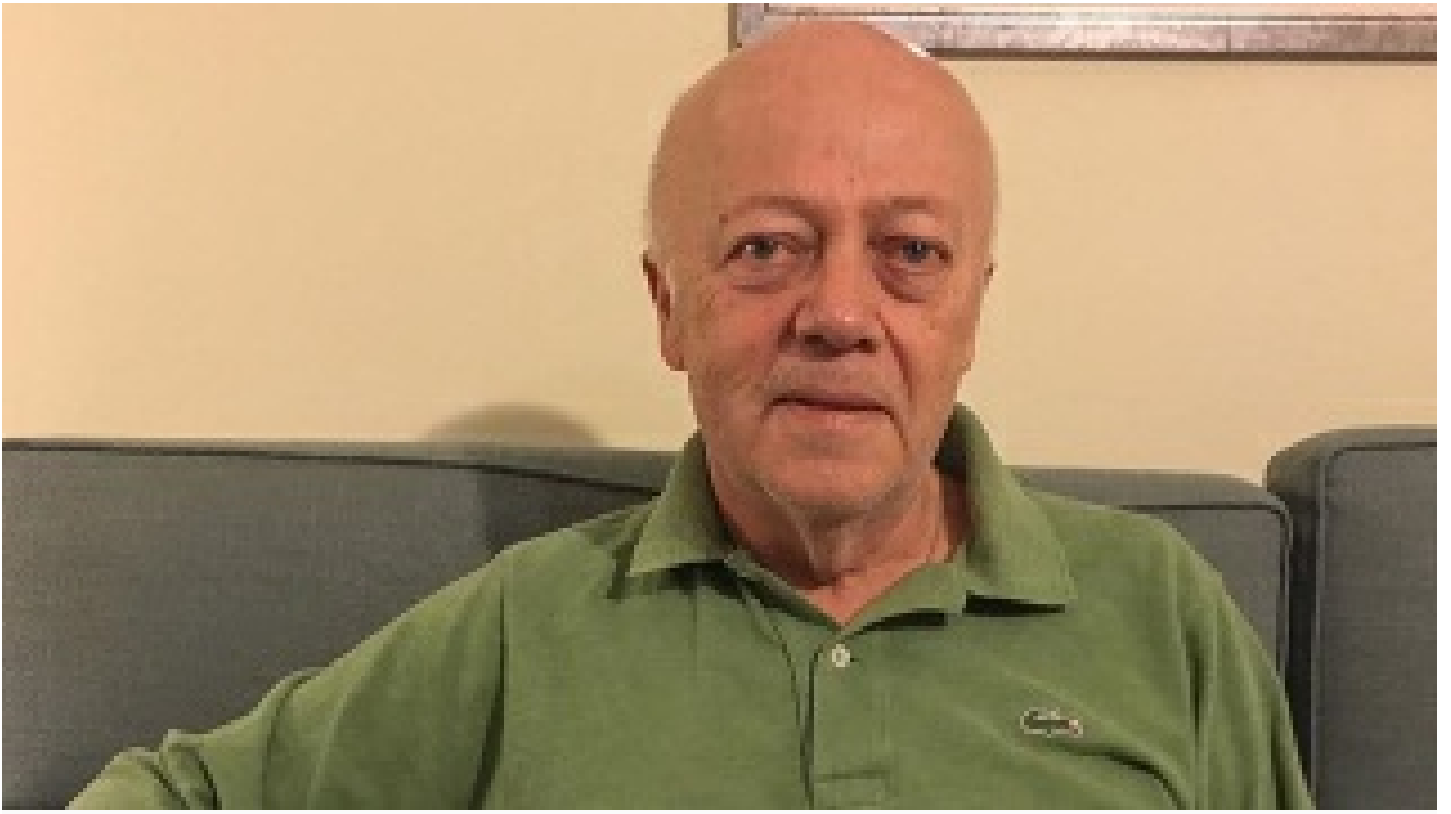
Can Baydarol ambargonun olası etkilerini anlattı: Türkiye'nin stratejik önemi daha da artacak