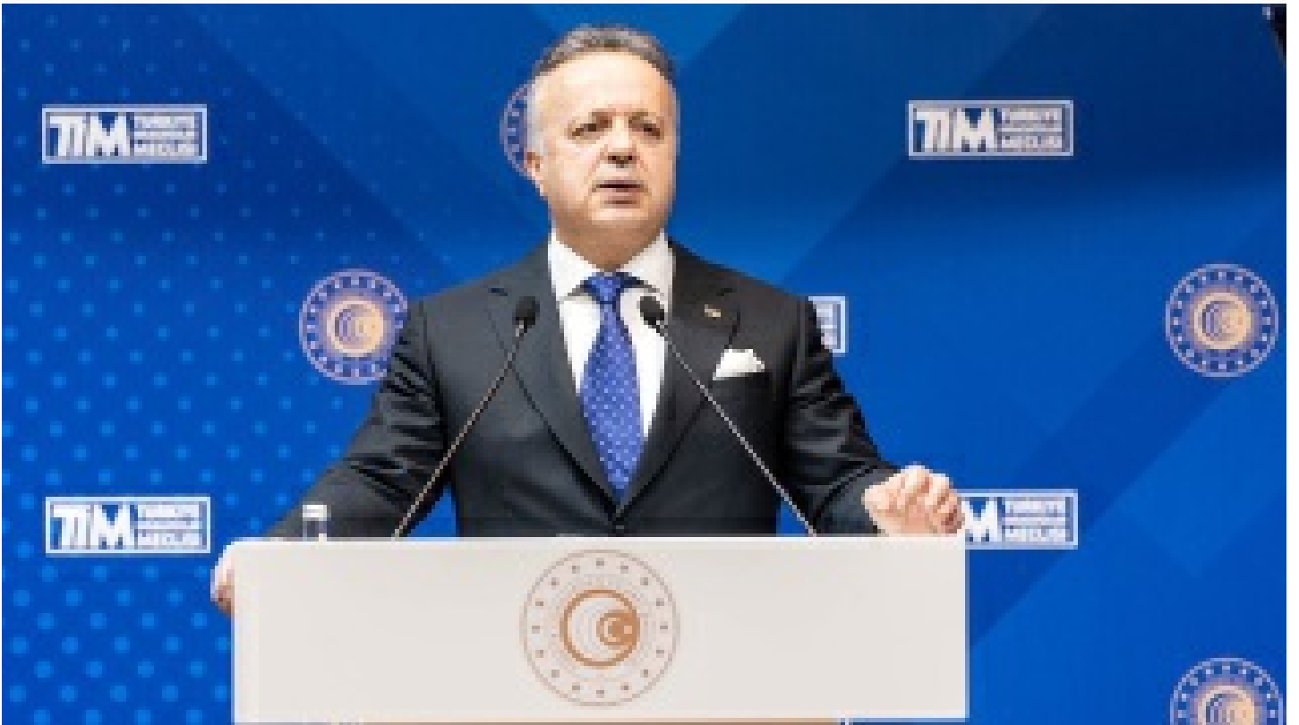
TİM Başkanı Gülle: Yerel paralarla ticaretin en doğrusu olduğu görüldü