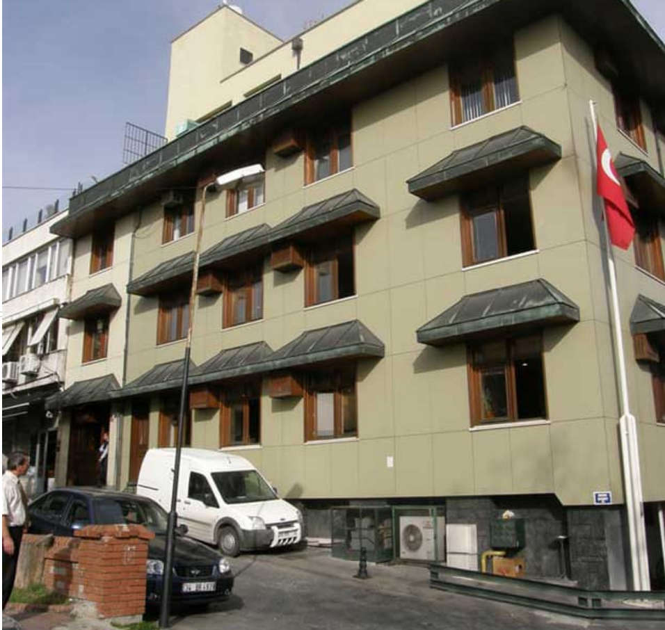
BİK yıkılan bina

Basın İlan Kurumu'nun dövizle kira ödeme dönemi 2011 yılında başladı. Odatv'nin kulislerden edindiği bilgilere göre, 40 milyon dolar değerindeki İstanbul Sultanahmet'teki genel müdürlük binasını 2011 yılında boşaltan Basın İlan Kurumu, binanın tadilatının yapılmasının ardından geri döneceğini açıklamıştı. Ancak tarihi bina yıkıldı! Yıkılan bina, Binbirdirek Sarnıcı'na zarar verdiği gerekçesiyle enkaz halinde bekletiliyor. Binanın sırf kira ödemek için bilerek yıkılıp yıkılmadığı iddiaları ise ortada duruyor.