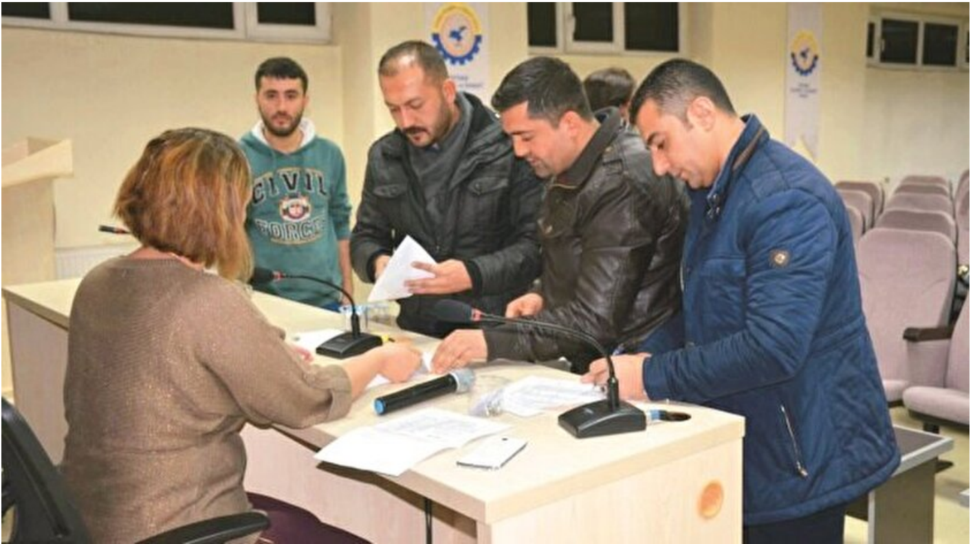
Oda seçimlerinde 2 yıl şartı

Haber Merkezi · 29 Ağustos 2017, 04:00 · Yeni Şafak