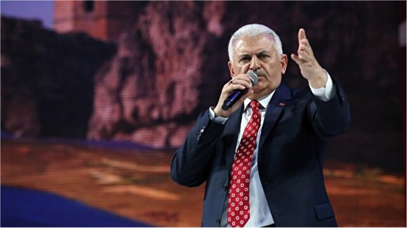
Başbakan Binali Yıldırım.

Haber Merkezi · 12 Nisan 2017, 10:35 · Son Güncelleme: 12 Nisan 2017, 14:01 · Yeni Şafak