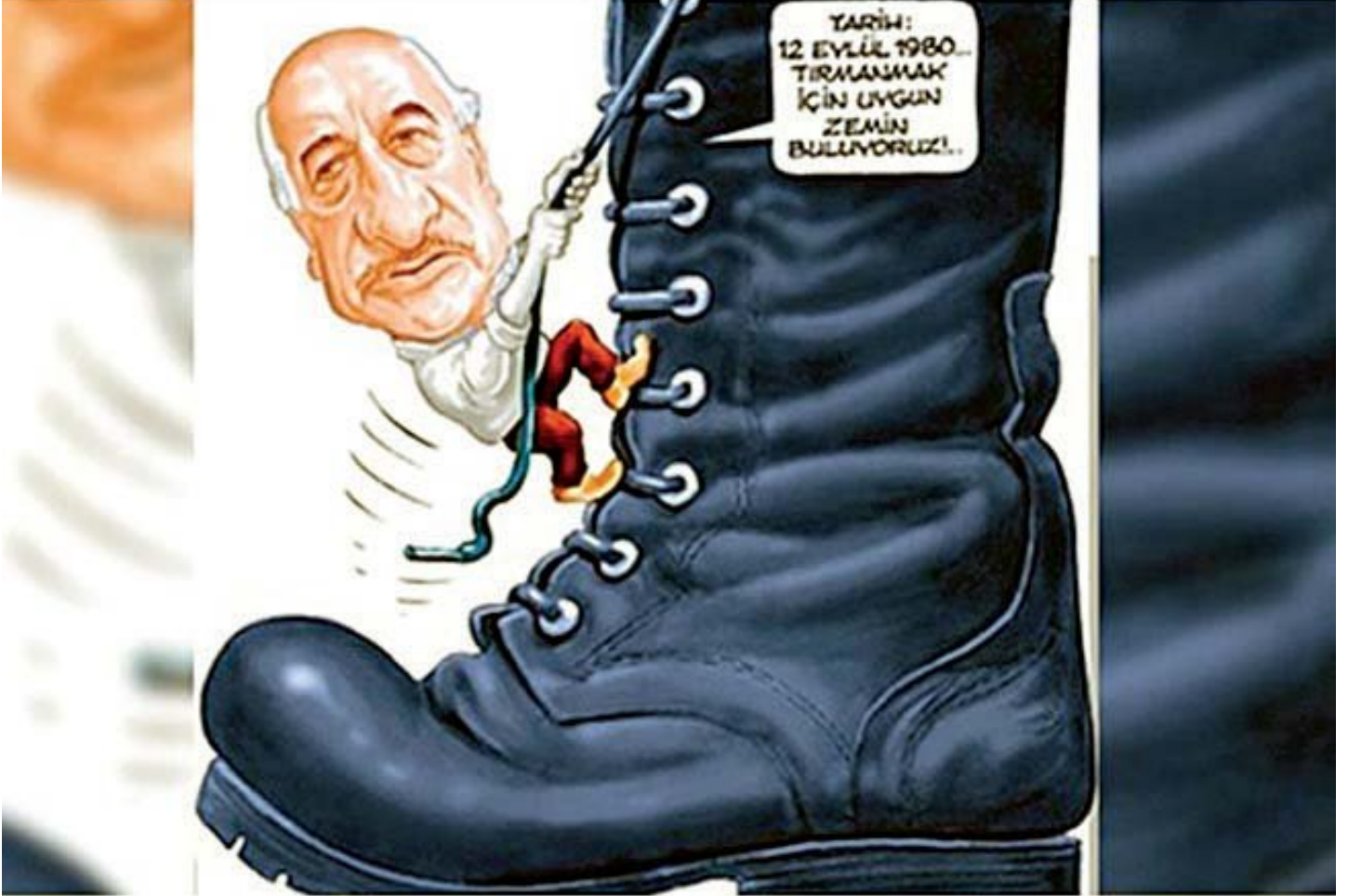
Musa Kart 2000'li yıllardan beri FETÖ tehlikesini çiziyordu.

üyesi olmamak ve örgüt adına suç işlememekle birlikte, hareketleriyle örgütün çıkarlarına hizmet etmekle suçlanıyorum. Tanıtım, çok net ve kısa olacak: Bu suçlamayı aynen iade ediyorum. Bir karikatüristi terör örgütlerine yardım ve yataklık yapmakla suçlamak sadece karikatüriste değil bu ülkeye kötülüktür. Karikatürle şiddete dayalı örgütlerin yan yana gelmesi eşyanın tabiatına aykırıdır. Tatil için aradığım numara yüzünden Silivri'de dokuz ay kaldım. Yanlış rezervasyon! 35 yıllık karikatüristim akıl almaz iddialarla suçlanıyorum. Suçlamayı aynen iade ediyorum.”