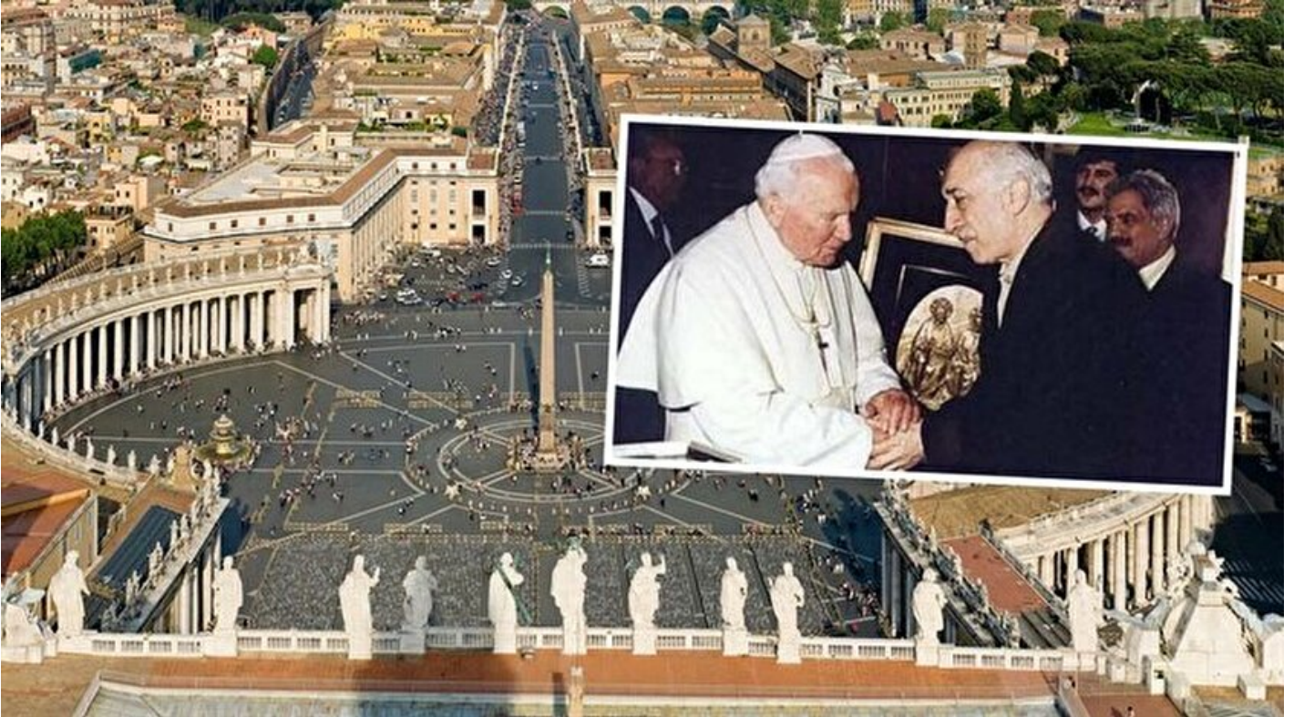
Şubat 1998'de Vatikan'ı ziyaret eden FETÖ elebaşı Gülen ve Papa 2. Jean Paul

Haber Merkezi · 11 Ağustos 2016, 11:44 · Son Güncelleme: 11 Ağustos 2016, 13:22 · AA