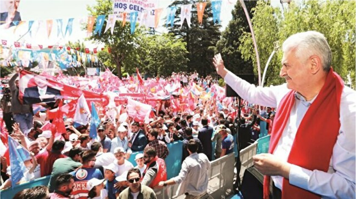
Başbakan Binali Yıldırım, Tokat ve Sivas mitinglerinde konuştu

Haber Merkezi · 17 Haziran 2018, 04:00 · Yeni Şafak