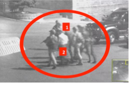
Hulusi Akar'ın bomba görüntüsü! Yanındaki sivil kim?

HEPSİNDEN AYRI AYRI ŞİKAYETÇİYİM: Akar, beyanının son kısmında, "Ayrıca şunu söylemek istiyorum: Bu hain terör örgütü yapılanması içinde olan ve şahsıma, milletime, silah arkadaşlarıma, emniyet mensubu kardeşlerime, devletin kurumlarına, Türk tarihi ve medeniyetimize bu derece zarar veren her kişiden ayrı ayrı şikayetçiyim" dedi. Akar'ın avukatı da "müvekkilinin beyanlarına aynen katıldığını" bildirdi.