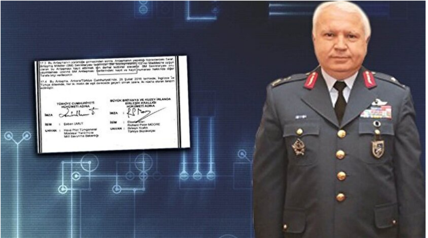
Milli Savunma Bakanlığı Müsteşar Yardımcısı Hava Pilot Tümgeneral Şaban Umud

Cihat Arpacık · 19 Haziran 2017, 04:00 · Son Güncelleme: 19 Haziran 2017, 17:53 · Yeni Şafak