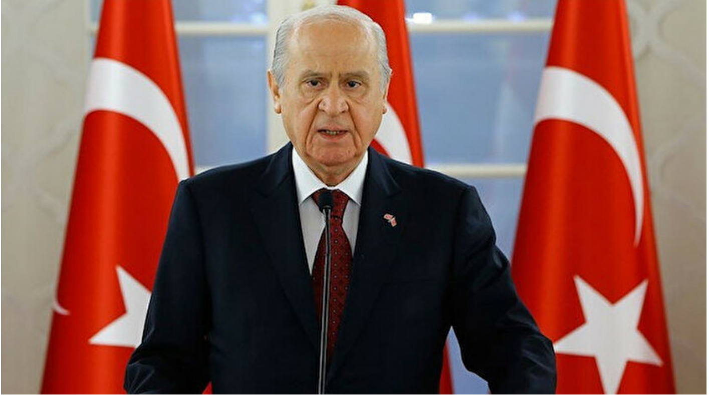
MHP Genel Başkanı Devlet Bahçeli

Haber Merkezi · 20 Ağustos 2020, 11:04 · Son Güncelleme: 20 Ağustos 2020, 12:35 · AA