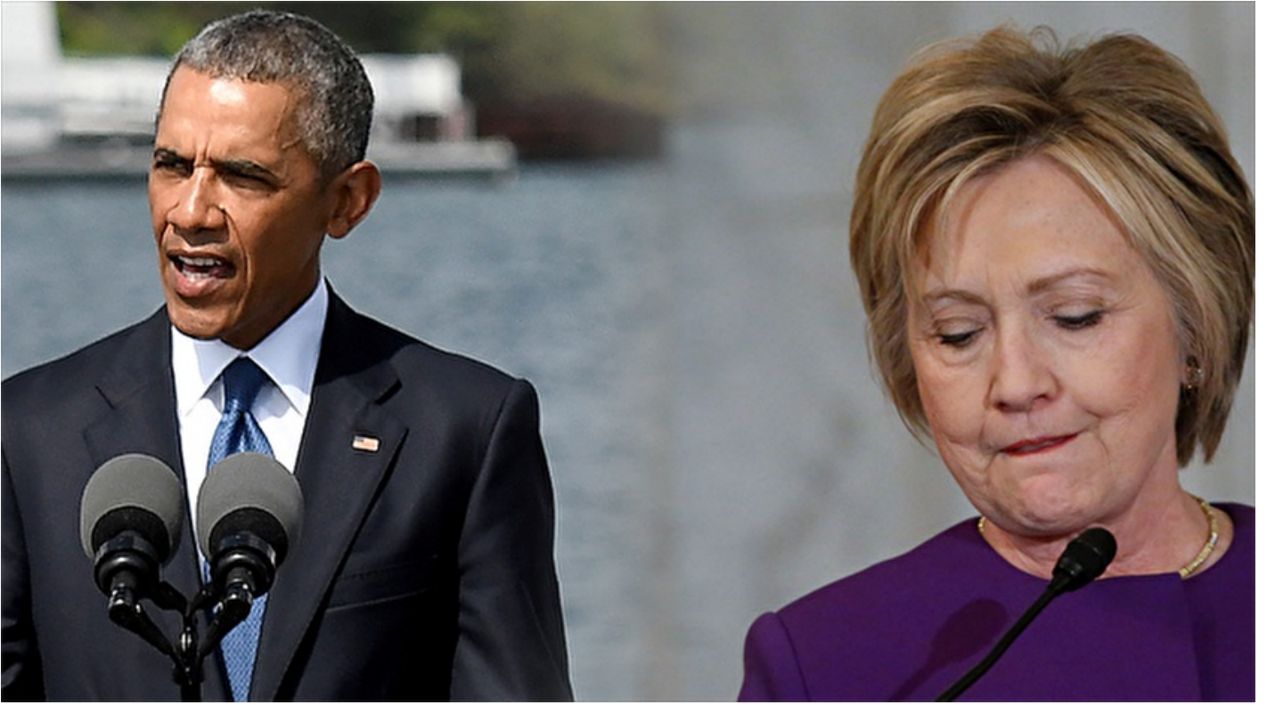
ABD Başkanı Barack Obama ve ABD'nin 45'inci dönem başkan adaylarından Hillary Clinton

Haber Merkezi · 28 Aralık 2016, 15:30 · Son Güncelleme: 28 Aralık 2016, 16:22 · Yeni Şafak