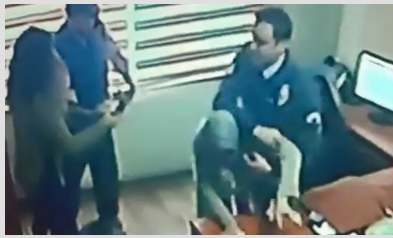
Yardım istedi, darbedilerek dışarıya atıldı