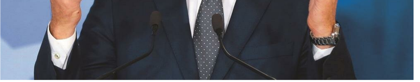
NATO Genel Sekreteri Jens Stoltenberg