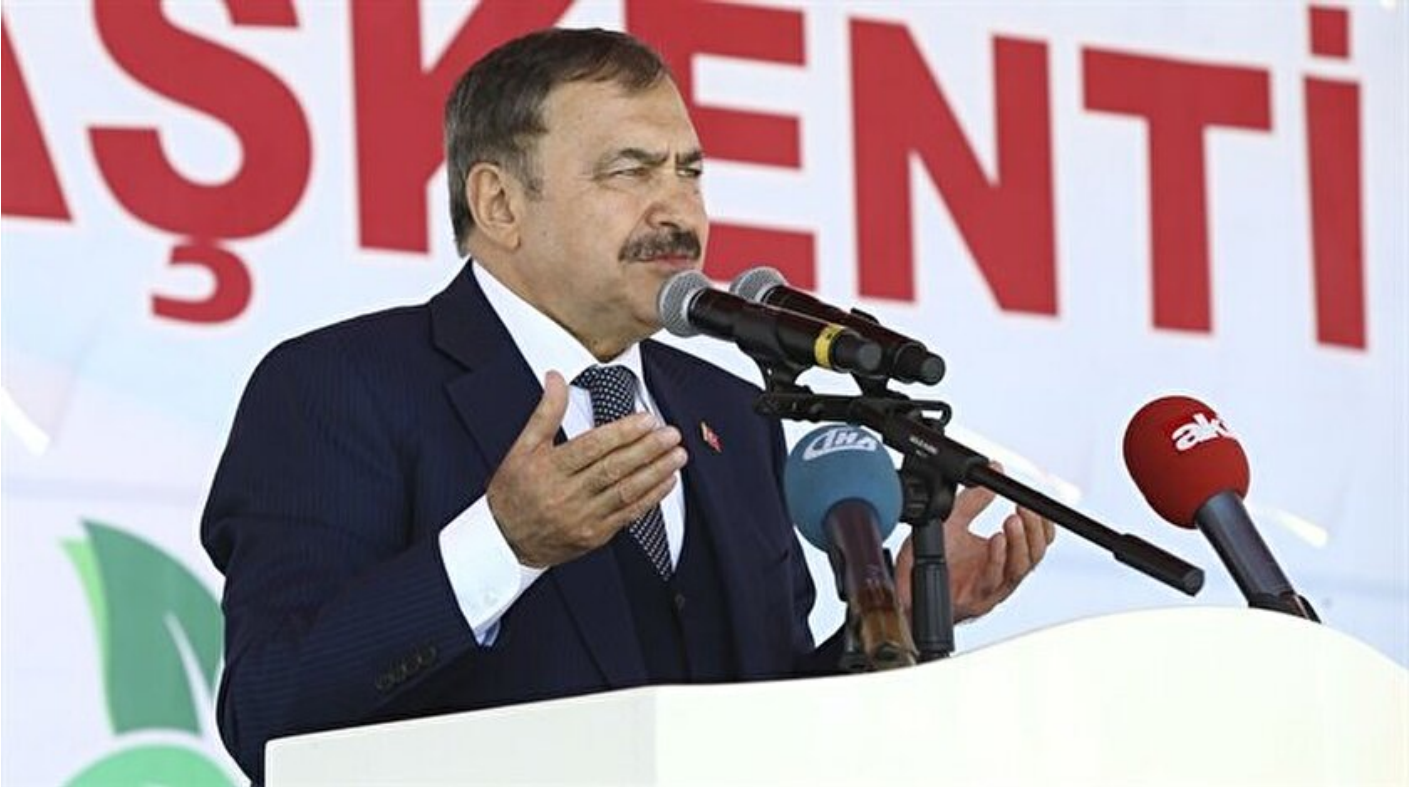
Orman ve Su İşleri Bakanı Veysel Eroğlu

Haber Merkezi · 26 Nisan 2018, 13:11 · Son Güncelleme: 26 Nisan 2018, 13:14 · AA