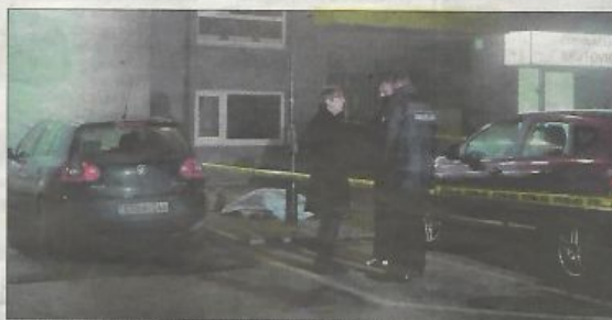
Užasna slika s mjesta tragedije: Dječak skočio s osmog sprata

- Majka sam, a moje dijete leži u hladnom grobu. Moj dječak, sat prije smrti, sjedio je na prozoru zgrade u kojoj je živio, a zatim je zapalio školski ruksak u džbenicama i zauvijek otišao sa ovoga svijeta. To je sve vidjela anonimna komšinica. Meni kao majci, ostaje pitanje kako da nam niko toga dana nije pokucao na vrata? Šta se može dogoditi djetetu, toliko strašno, toliko neizdrživo da to ne može podijeliti s rođenom majkom? Posljednjih sat vremena za me-